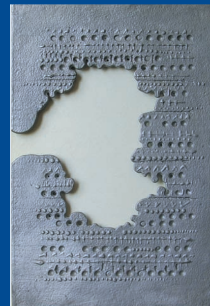
Roberto Papini Fusione metallo, cm 33,5x49 anni '80

L'esposizione di alcune opere di Roberto Papini, testimonianze artistiche mirabili e singolari quanto universali nel linguaggio, rappresenta un veicolo possibile di crescita e di integrazione culturali.